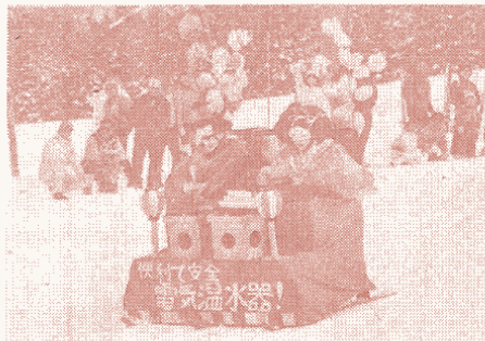
優勝の『早春ひな祭り号』