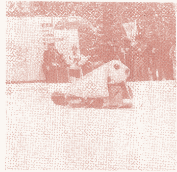
新幹線並のスピードの幼虫